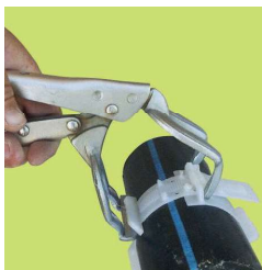
Applicazione di un collare D.